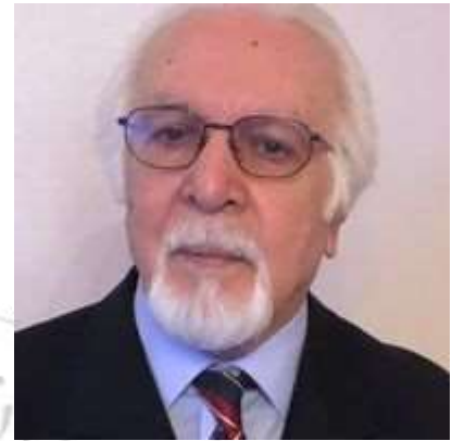
کانديد اکادميسن اعظم سيستاني