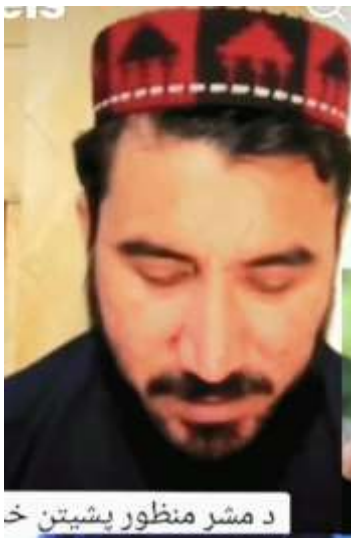
د مشر منظور پشیتن خ

منظور پشتون رهبر جنبش حراست پشتونها با تدویر جرگه قومی عدالت در میدان جمرو د خیبر پشتونخوا در تاریخ 11 اکتوبر 2024، بزرگترین پیروزی پشتونها را برای تحول درس نوشت خویش رقم زد. و در برابر سنگ اندازی و زورگویی اردوی ستمگر پنجاب با شجاعت و دلیری ایستادگی کرد و بالاخره آن جرگه پرشکوه را با حضور ده ها هزار جوان و پیر پشتون از سراسر ایالت پشتونخوا و بلوچستان در میدان جمرو، جای که 187 سال قبل وزیر محمد اکبر خان فرزند امیر دوست محمد خان بارکزی در آنجا لشکر رنجیت سینگ پنجابی را شکست داده بود، تدویر نمود. این پیروزی را به تمام پشتونهای آنسوی خط تحمیلی دیورند تبریک میگویم.