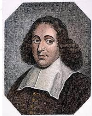
باروخ سپنوزا Baruch Spinoza

په انگلستان کې هم په همدغه ډول علم دکليسا ترستم لاندی وو. علم دکليسا ترسرحد نه سواي تيريدای. دغه بورژوازي اقتصادي مناسبات وه چي کلیسا او مذهب يې تر قانون لاندې راوستی. او په 1662م کال کې دلندن د علومو شاهي ټولنه جوړه سوه. آزاد فکر او علم خپله لاره دمذهب او کلیسا څخه بيله کړه. همدغسي بيا په 1666م کال په فرانسه کې هم د علومو اکاډمي جوړه او په ټوله اروپا کې دانسان دوستی فلسفه را منځته سوه. او په ادبياتو کې آزاد بحثونه او دکلاسيکو ادبياتو ځای رومانتيکو ادبياتو ونيوه، او تردې وروسته بيا جان لاک - ولتر - منتيکو او ژان ژاک روسو دغه لړۍ او مبارزه مخ ته بوتلل. دفيوداليزم او کلیسا دماتي څخه وروسته علم په برياليتوب پرمخ ولاړی. او په 1776م کال کې دفکر د آزادۍ څخه په گټه اخيستلو سره امريکا هم داروپاي هيوادونو څخه خپله خپلواکي ترلاسه کړه. په نړۍ کې ديکتاتوري ټولني مطلقه شاهي نظامونو خپل ځای پارلماني او جمهوري سيستمونو ته پريښود. چي دغه ټوله د سپنوزا آزاد فکر له برکته وه.